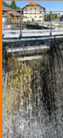
Wasserkraft: Platz 1