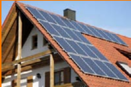
Sonnenenergie: Platz 1