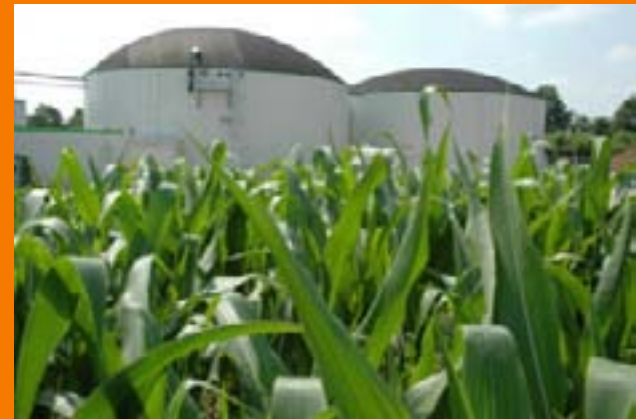
Bioenergie: Platz 1