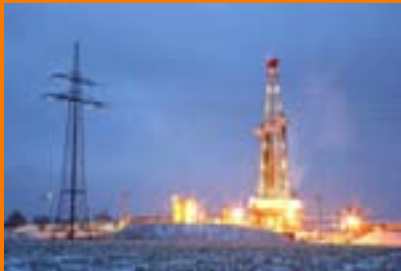
Erdwärme: Platz 1