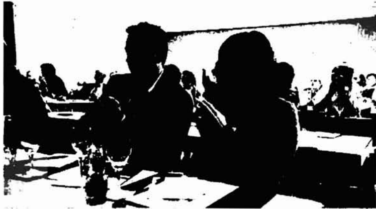
Potenzielle Prokon-Anleger freuen sich auf 8 Prozent Zinsen